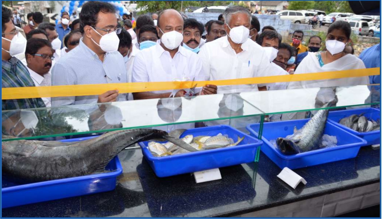
மகளிர் சுய உதவிக் குழுக்களின் மீன்கள் விற்பனையகத்தைத் திறந்து வைத்தல்