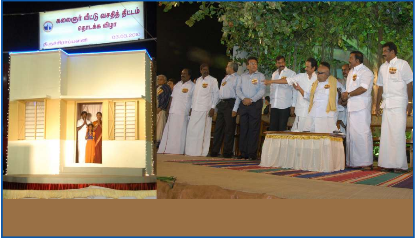
கலைஞர் வீட்டு வசதித் திட்டம் தொடக்க விழா