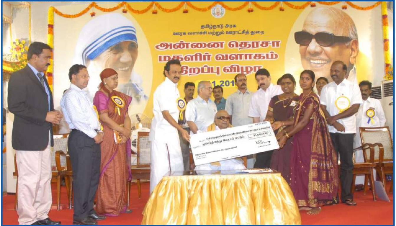
ஊராட்சி அளவிலான கூட்டமைப்பிற்கு வங்கிக்கடன் வழங்குதல்