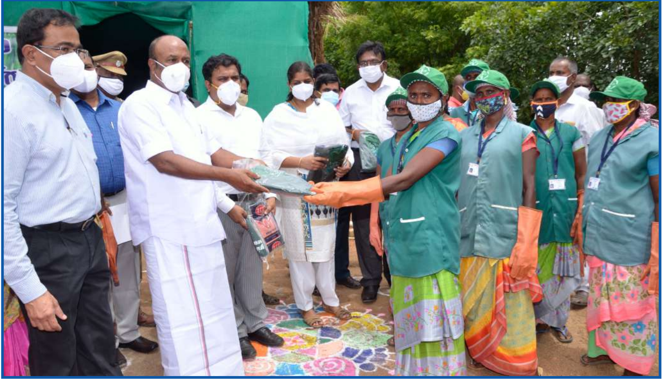
தூய்மைக் காவலர்களுக்கு சீருடை வழங்குதல்