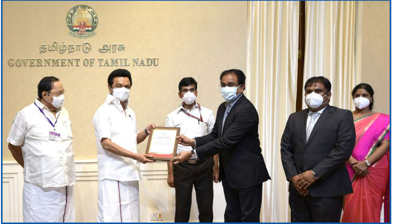
உங்கள் தொகுதியில் முதலமைச்சர் திட்டத்தில் சிறப்பாக பணியாற்றியமைக்கு மாண்புமிகு தமிழ்நாடு முதலமைச்சர் அவர்களின் பாராட்டு